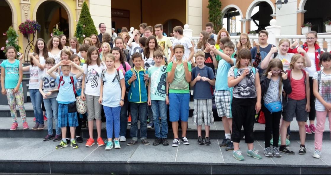
Fahrt der Messdienerinnen und Messdiener ins PhantasiaLand am 27. Juni bei schönem Wetter