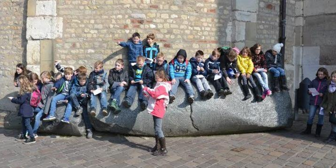
Foto vom Kommunionkinder Ausflug am 12. März in die Bistumsstadt Trier (Domstein)