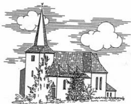
St. Katharina Karweiler