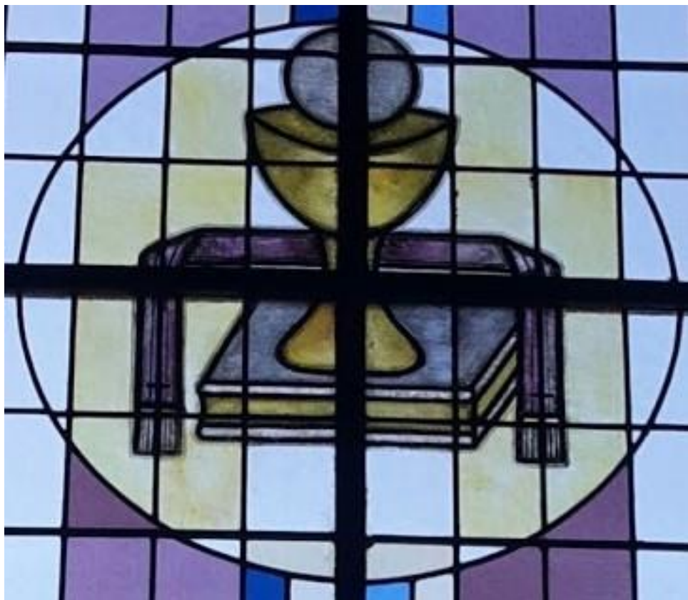
Pfarrkirche Gelsdorf: Fenstermedallion Sakrament der Priesterweihe